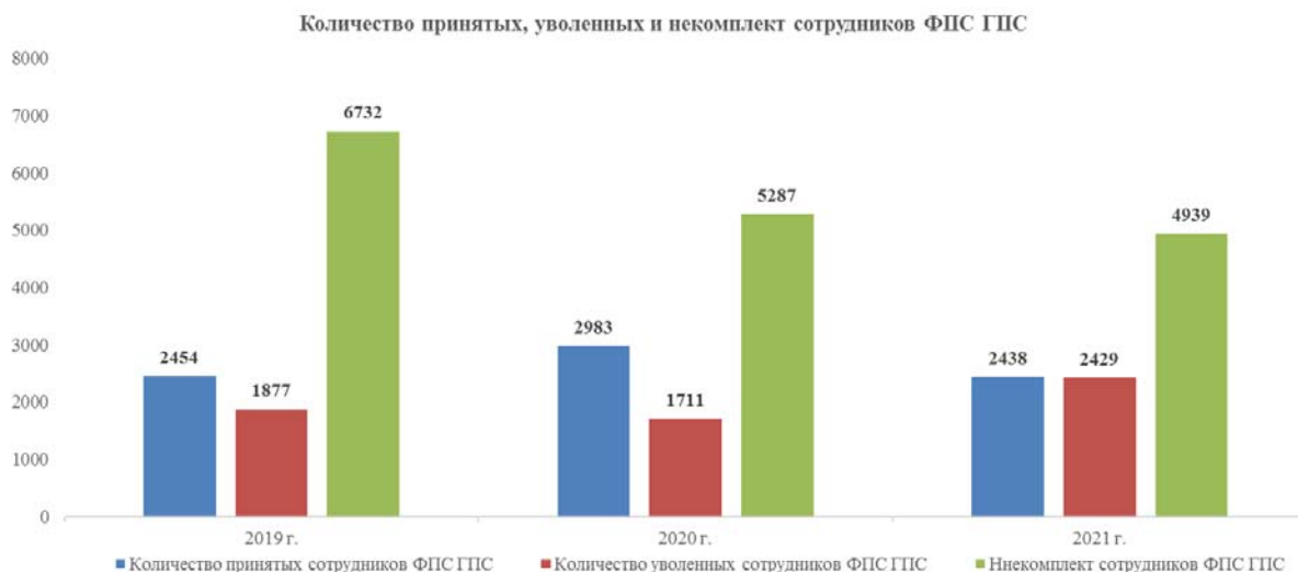
Рис. 1. Количество принятых, уволенных и некомплект сотрудников ФПС ГПС

За 2019 год в ФПС ГПС принято 2454 сотрудника, что составляет 5,8 % от штатной численности сотрудников ФПС ГПС, уволено всего 1877 сотрудников, что составляет 4,4 % от штатной численности сотрудников ФПС ГПС. За 2020 год в ФПС ГПС принято 2983 сотрудника, что составляет 7,0 % от штатной численности сотрудников ФПС ГПС, уволено всего 1711 сотрудников, что составляет 4,0 % от штатной численности сотрудников ФПС ГПС. За 2021 год в ФПС ГПС принято 2438 сотрудников, что составляет 5,7 % от штатной численности сотрудников ФПС ГПС, уволено всего 2429 сотрудников, что составляет 5,7 % от штатной численности сотрудников ФПС ГПС. На рис. 1 показано наглядно по годам количество принятых, уволенных и некомплект сотрудников ФПС ГПС.