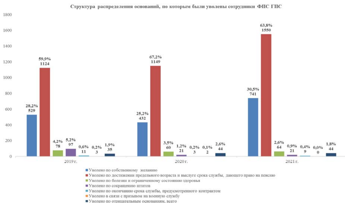
Рис. 4. Структура распределения оснований, по которым были уволены сотрудники ФПС ГПС

ников – 4,2 %; по сокращению штатов 97 сотрудников – 5,2 %; по окончании срока службы, предусмотренного контрактом, 11 сотрудников – 0,6 %; в связи с призывом на военную службу 3 сотрудника – 0,2 %; по отрицательным основаниям 35 сотрудников – 1,9 %. В 2020 году всего уволено 1711 сотрудников ФПС ГПС (4,6 % от фактического наличия), по собственному желанию уволилось 432 сотрудника, что составляет – 25,2 % от всех уволенных; по возрасту и выслуге лет 1149 сотрудников – 67,2 %; по болезни и ограниченному состоянию здоровья 60 сотрудников – 3,5 %; по сокращению штатов 21 сотрудник – 1,2 %; по окончании срока службы, предусмотренного контрактом, 3 сотрудника – 0,2 %; в связи с призывом на военную службу 2 сотрудника – 0,1 %; по отрицательным основаниям 44 сотрудника – 2,6 %. В 2021 году всего уволено 2429 сотрудников ФПС ГПС (6,4 % от фактического наличия), по собственному желанию уволился 741 сотрудник, что составляет 30,5 % от всех уволенных; по возрасту и выслуге лет 1550 сотрудников – 63,8 %; по болезни и ограниченному состоянию здоровья 64 сотрудника – 2,6 %; по сокращению штатов 21 сотрудник – 0,9 %; по окончании срока службы, предусмотренного контрактом, 9 сотрудников – 0,4 %; в связи с призывом на военную службу уволенных сотрудников нет; по отрицательным основаниям 44 сотрудника – 1,8 %. Структура распределения оснований, по которым были уволены сотрудники ФПС ГПС, представлена на рис. 4.